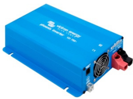
Phoenix Inverter 12/750