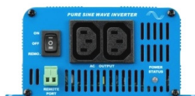
Phoenix Inverter 12/350 with IEC-320 sockets