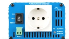
Phoenix Inverter 12/180 with Schuko socket