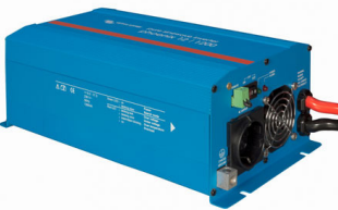
Phoenix Inverter 12/800 with Schuko socket